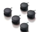
マルチキャスターPRO:ウレタンキャスター(5個) (CP6NP1):¥2,500(税別)