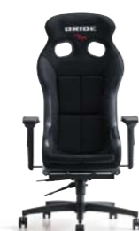
XERO VS ゼロVS ¥130,000(税別)～