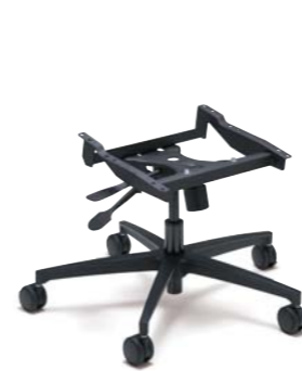
マルチキャスターPRO:ROタイプ (CRONPO):¥22,000(税別)