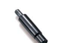
マルチキャスターPRO:ガススプリング (CP4NP1):¥5,000(税別)