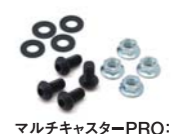
マルチキャスターPRO:ブラケットボルトセット (CP3NBT):¥500(税別)