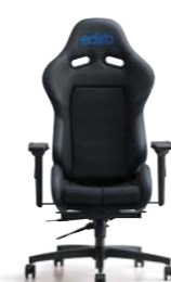
edirb 033 エディルP033 ¥227,300(税別)