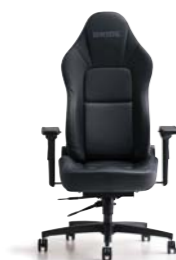
STREAMS ストリームス ¥124,000(税別)～