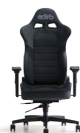
edirb 032 エディルP032 ¥182,000(税別)～