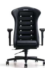
HISTRIX ヒストリックス ¥202,000(税別)