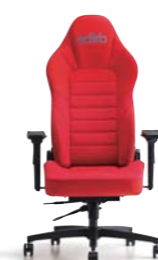
edirb 110 エディルP110 ¥182,000(税別)～