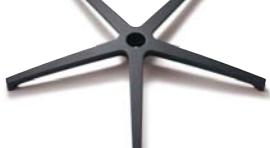
マルチキャスターPRO:5本脚アルミキャスターフレーム (CP5NP1):¥7,000(税別)