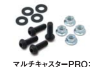
マルチキャスターPRO:シート取付けボルトセット (CP2NBT):¥500(税別)