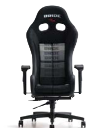
ZIEGIV ジークIV ¥140,000(税別)～