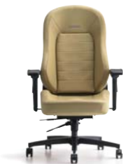
EUROSTERII SPORTE ユーロスターII スポルテ ¥187,000(税別)