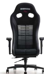
ZIEGIV WIDE ジークIVワイド ¥150,600(税別)～