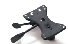
マルチキャスターPRO:ベース機構ブラケット (CP3NP1):¥10,000(税別)