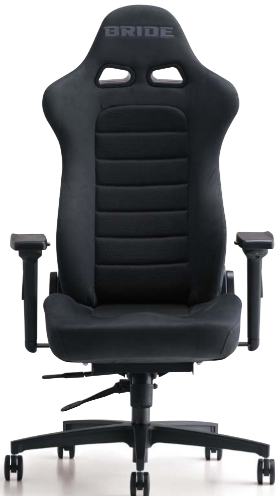
EUROSTERII ユーロスターII ¥124,000(税別)～

※本頁(P7)に記載の表示価格には、シート本体価格に加え、取付けに必要なアダプター類、マルチキャスターPRO本体の価格が含まれています。