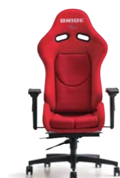
STRADIAII ストラディアII ¥218,800(税別)～