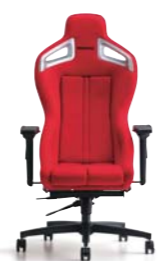
A.i.R. エア- ¥145,000(税別)