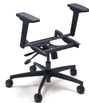
マルチキャスターPRO:ROタイプ・アームレスト付 (CRONPA):¥30,000(税別)