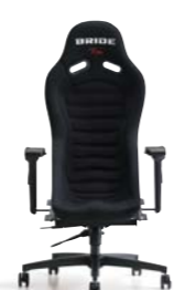
ZODIA ソディア ¥120,600(税別)