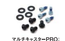
マルチキャスターPRO:アームレストボルトセット (CP1NBT):¥500(税別)