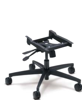
マルチキャスターPRO:YOタイプ (CYONPO):¥22,000(税別)