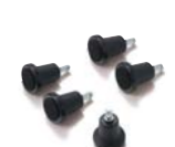
マルチキャスターPRO:固定脚(5個) (CP6NP2):¥1,500(税別)