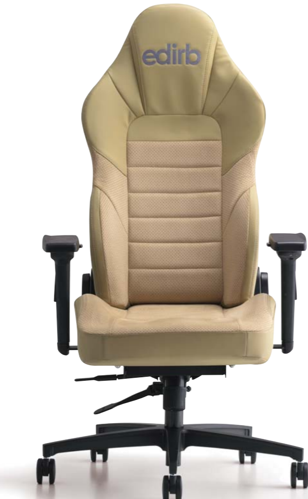
edirb 110 エディルP110 ¥182,000(税別)～