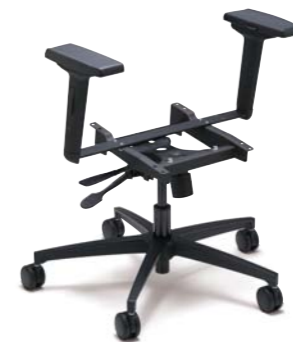
マルチキャスターPRO:YOタイプ・アームレスト付 (CYONPA):¥30,000(税別)