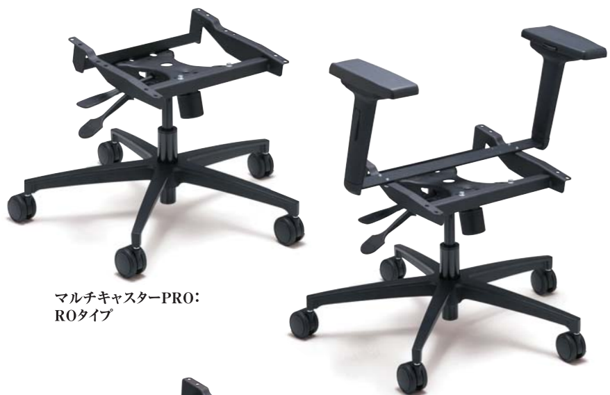
マルチキャスターPRO: ROタイプ

BRIDEが世界有数のチェアパーツメーカーと共同開発した【マルチキャスターPRO】は、BRIDEシートをリビング、オフィス、e-Sportsなど、インドアで使えるようにするための高機能・高品質ツールです。