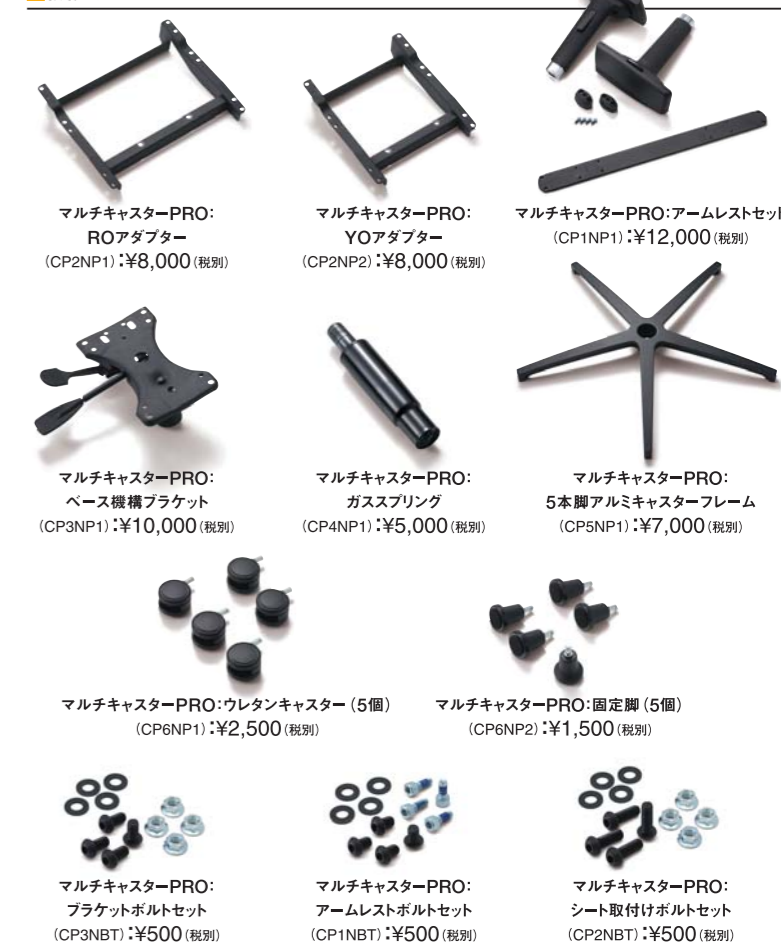
マルチキャスターPRO:ROアダプター (CP2NP1):¥8,000(税別)