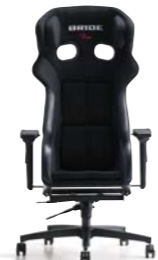
XERO RS ゼロRS ¥175,000(税別)～