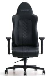
ZAOU ザオウ ¥138,000(税別)～