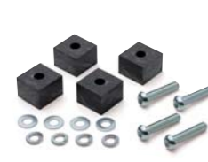
ハイポジアダプター (A15NPO):¥3,800(税別)