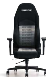
DIGOIII LIGHT ディーゴIIIライト ¥115,000(税別)～